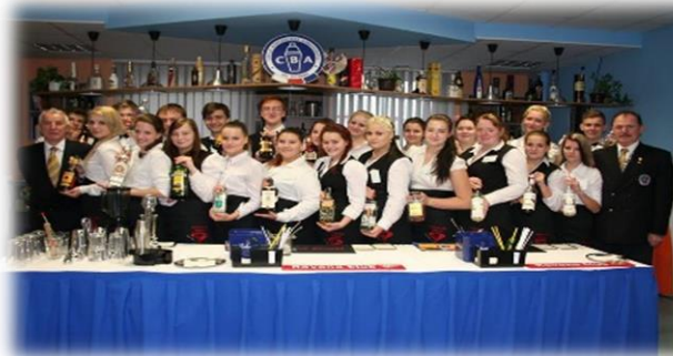
Účastníci barmanského kurzu i s lektory.